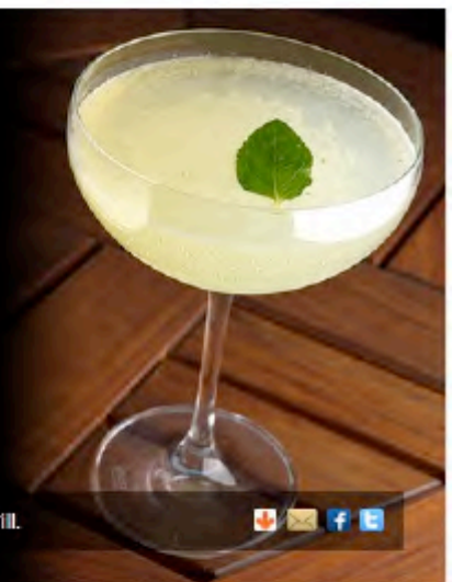
Un coctel en el restaurante J&G Grill.