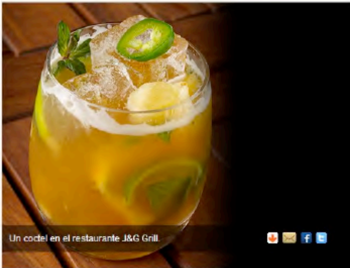
Un coctel en el restaurante J&G Grill.